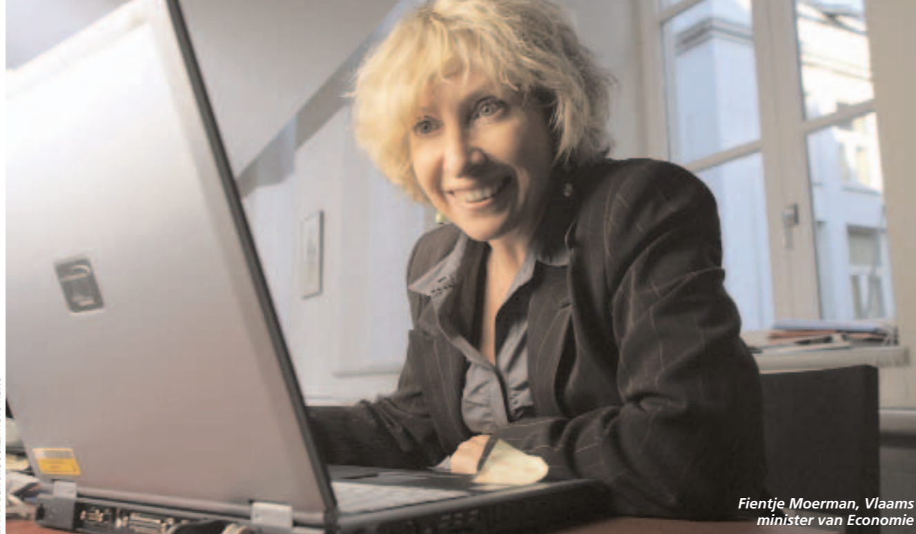
Fientje Moerman, Vlaams minister van Economie

Fientje Moerman (VLD), Vlaams Minister van Economie